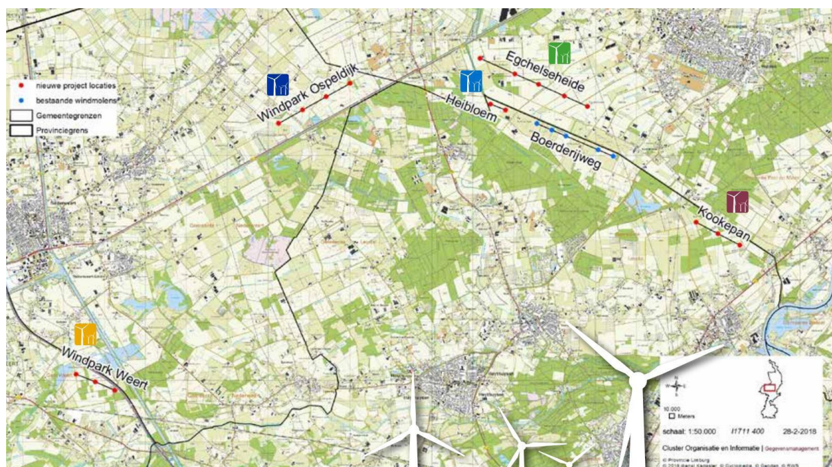
Fig. 2 De ligging van de parken in Midden-Limburg

In de omgeving liggen ook de windparken Heibloem, Kookepan en Egchelse Heide. Die windparken hebben eigen invloedssferen. Er bestaat enige overlap tussen de invloedssferen, vooral tussen Egchelse Heide en Heibloem. Bij ingediende subsidieverzoeken van initiatieven uit het grensgebied van windparken, of initiatieven met een groter geografisch bereik vindt onderlinge afstemming plaats tussen de adviescommissies