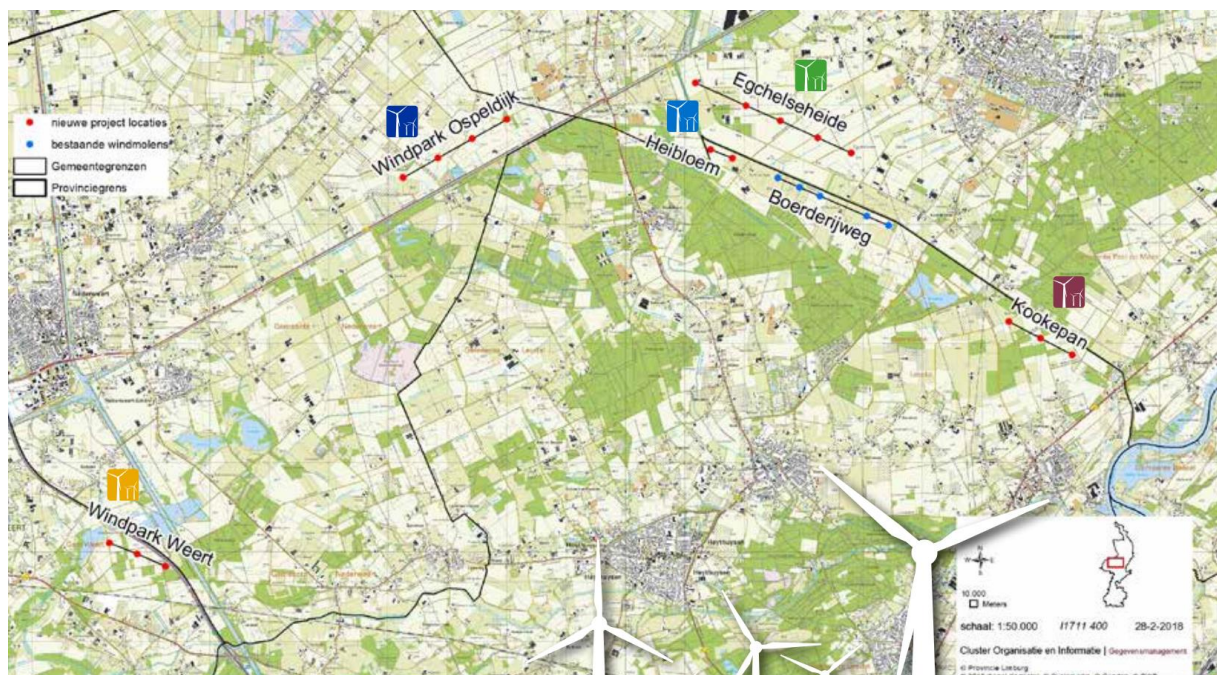
Fig. 2 De ligging van de parken in Midden-Limburg

In de omgeving liggen ook de windparken Heibloem, Kookepan en Eghelse Heide. Die windparken hebben eigen invloedssferen. Er bestaat enige overlap tussen de invloedssferen, vooral tussen Eghelse Heide en Heibloem Bij ingediende subsidieverzoeken van initiatieven uit het grensgebied van windparken, of initiatieven met een groter geografisch bereik vindt onderlinge afstemming plaats tussen de adviescommissies