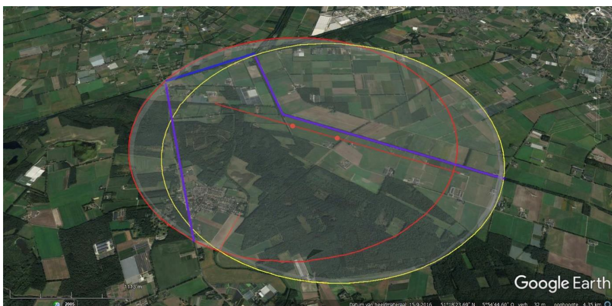
Fig.3 De invloedsfeer van Windpark Heibloem .

Tussen de parken bestaat samenwerking. Als principe willen wij voorstellen, dat elk park haar eigen unieke invloedsfeer definieert. Voor Heibloem zou dat dan het gebied zijn in een gedeeltelijke cirkel van 2 km om de molens (rood en geel in figuur 3) en verder daarbinnen begrensd door de Snepheiderbeek, het afwateringskanaal en de Noordervaart en de N562 (blauw op de Google-Earth kaart). Praktisch is dat het dorp Heibloem met omgeving, inclusief Witdonk (gemeente Peel en Maas). Zie de kaart van Google Earth (figuur 3).